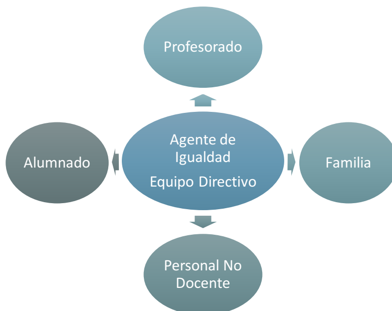
Ilustración 3: Diagrama del Grupo de Trabajo coordinado por el Equipo Directivo.

El grupo de trabajo debe estar formado por representantes de todos los sectores de la Comunidad Educativa: